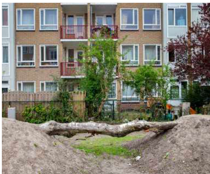
Oude berkenbomen worden hergebruikt als evenwichtsbalk

zag. Tegenwoordig mag het allemaal wat natuurlijker.' Ook de manier waarop de tuinen onderhouden worden is natuurlijk. Van Ginkel gebruikt geen chemische bestrijdingsmiddelen in de tuinen van Stadgenoot. In plaats daarvan kan de natuur zelf een handje helpen. Zo kun je lieveheersbeestjes inzetten bij een luizenplaag en worden de planten zo goed verwend dat de plantvakken dichtgroeien. Hierdoor krijgen ongewenste kruiden geen kans.